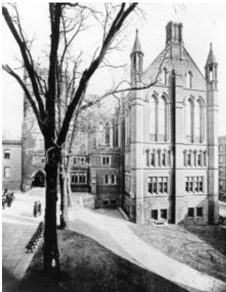
Nygotiska Law Library på Columbia Madison Avenue Campus

Innan Columbia Law School grundades fanns ingen juridisk utbildning överhuvudtaget i New York. De flesta av de då ledande verksamma advokaterna hade fått sin utbildning på andra juristkontor och genom enskilda studier. Genom grundandet av Columbia Law School kunde juridik som vetenskap utvecklas och en kvalitetssäkring garanteras avseende de som genomgick juristutbildningen vid skolan.