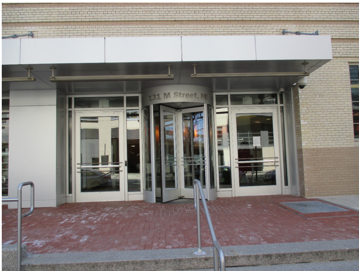
Exteriör bild från EEOCs huvudkontor i Washington DC

Jag sökte därför upp EEOCs huvudkontor och gick in i receptionen som var bevakad av flera vaktare. Jag presenterade mitt ärende och vädjade om att få träffa någon tjänsteman men möttes av beskedet att på grund av säkerhetsskäl så släpptes ingen obehörig in i fastigheten.