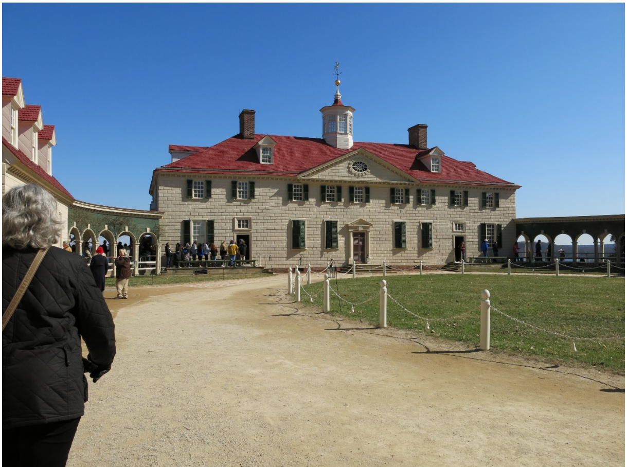
Besök vid George Washingtons privatbostad, Mount Vernon

Mount Vernon är närmast att likna vid en herrgårdsliknande plantage. Där fanns slavar och deras bostäder, stor jordbruksproduktion, väveri, smedja mm. Inne i herrgården fanns George Washingtons skrivbord, pennor och papper bevarade från den tid han var president. Den säng där han avled finns även den att beskåda. Historiens vingslag gjorde sig verkligen påmind.