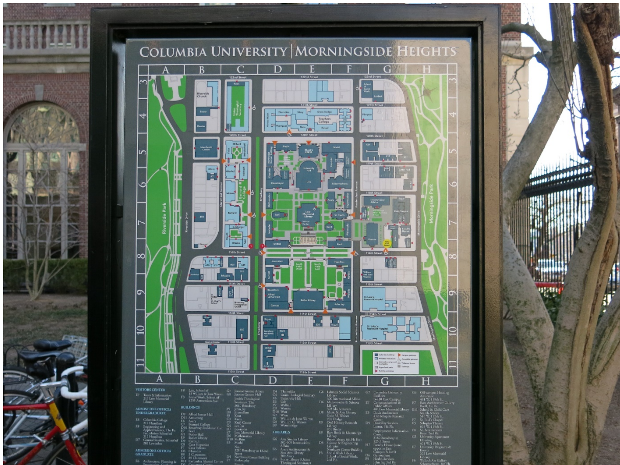
Karta över Columbia University och dess stora campusområde

Det gigantiska universitetsområdet har egna matvaruaffärer, gym, restauranger och även egna dagis. Det framstår som en helt egen isolerad värld och är ändå centralt beläget på Manhattan!