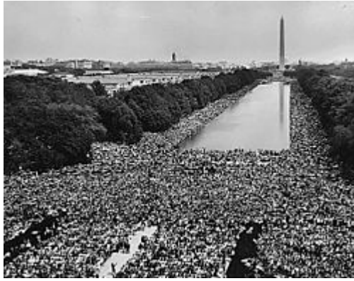
Folkmassan framför Lincolnmonumentet