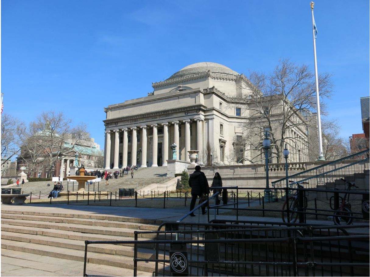
Law Memorial Library