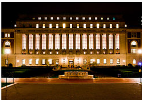
Butler Library vid Morningside Campus.